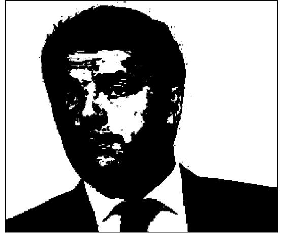
Matteo Renzi, presidente del Consiglio dei ministri

delle rivendicazioni e delle proteste dei lavoratori pubblici. Piuttosto, impieghi il suo prezioso tempo per svolgere al meglio la funzione che il parlamento gli ha affidato per risolvere le gravi questioni che lavoratori pubblici e sindacati rappresentativi hanno da tempo sollevato davanti alle massime istituzioni.